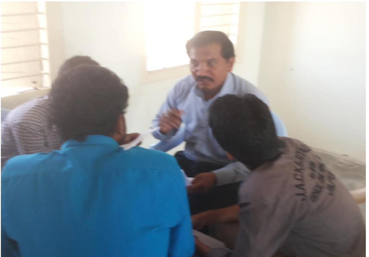
➤ Photo Session with Subhagruha Projects PVT Ltd and Abhivrudhi Vet India Pvt. Ltd