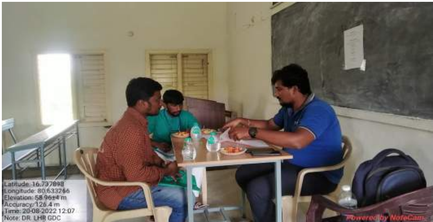
Room No.208 : Randstand India Private Limited