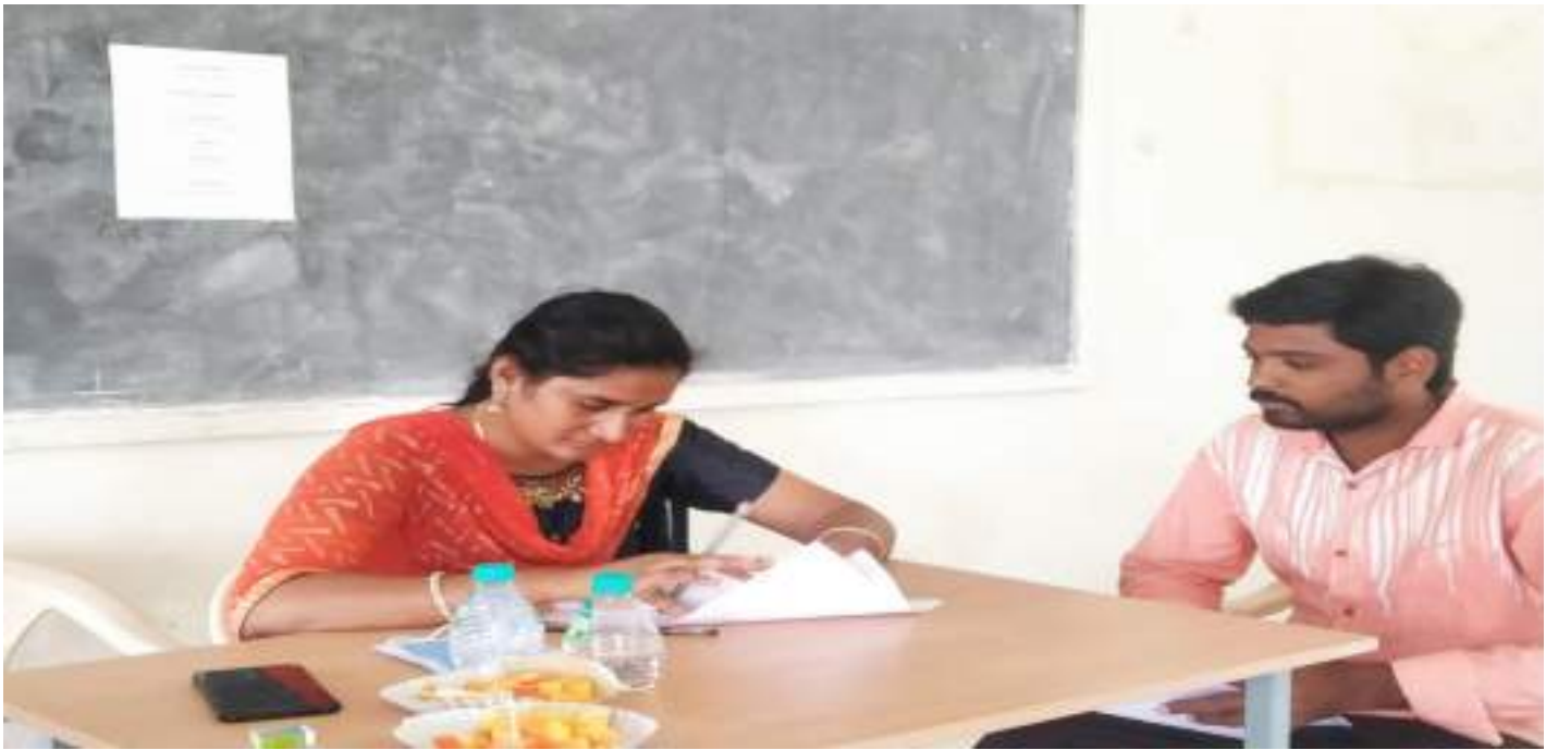
Room No.109 : Coramandel International Ltd