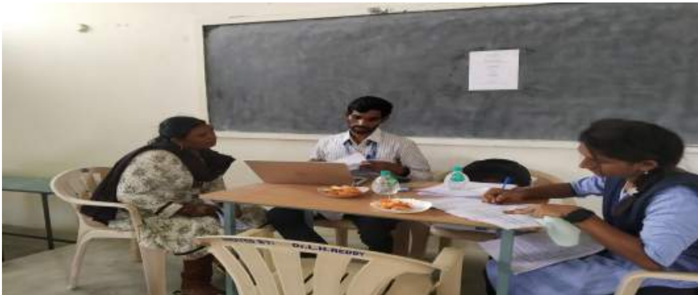
The principal handing out the Offer letters to the selected candidates