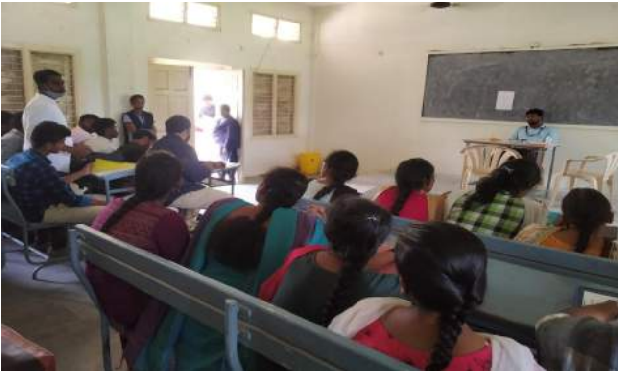
Room No.102 : Reliance Jio Info Com