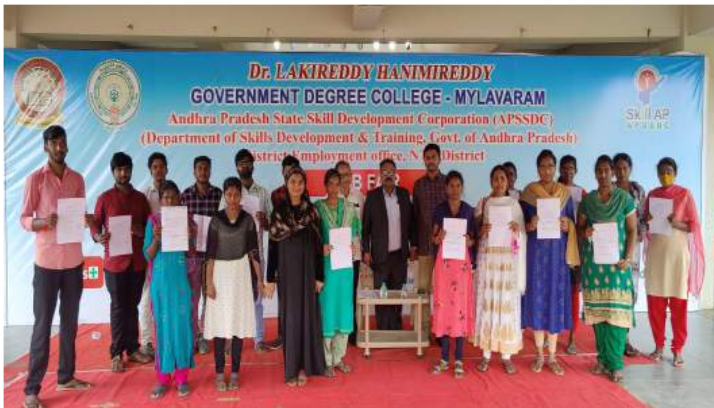
The Selected candidates displaying their offer letters