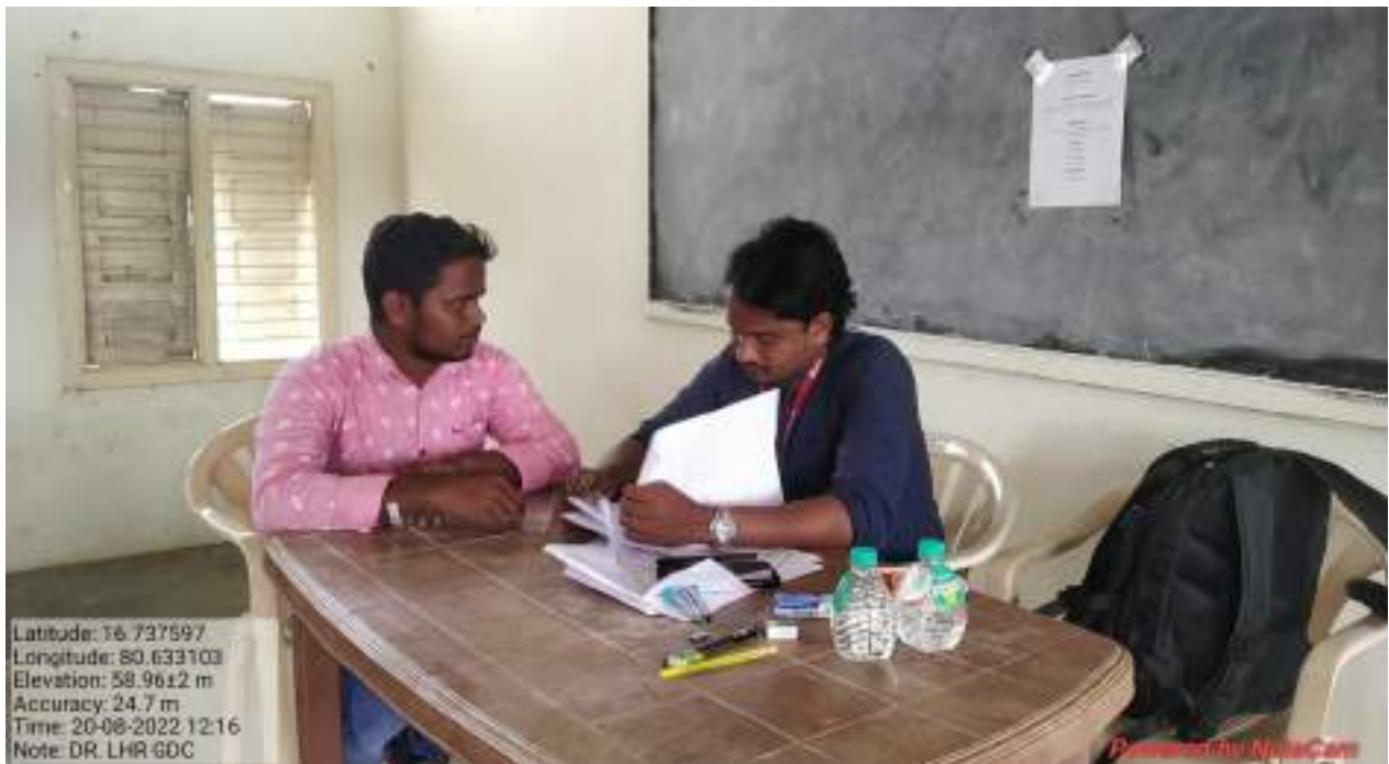
Room No. 106 : Adept Talent Acquisition India Private Limited