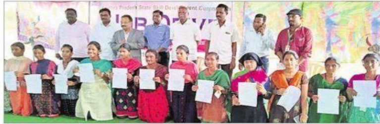
నియామక పత్రాలు అందుకున్న యువతతో కళాశాల యాజమాన్యం, జేకేసీ సిబ్బంది

మైలవరం: కళాశాల ఆధ్వర్యంలో నిర్వహిస్తున్న జాబ్మేళాతో యువతలో నూతన ఉత్సాహం పెరుగుతుంది. ఇంటర్మీడియట్ హాజరవడం ద్వారా యువతలో భయాందోళనలుపోయి పోటీతత్వం పెరుగుతుంది. తరచూ నిర్వహిస్తున్న జాబ్మేళాలతో యువతలో ఉద్యోగం వస్తుందన్న భరోసా కలుగుతుంది. ముఖ్యంగా వైఎస్సార్సీపీ ప్రభుత్వం అధికారంలోకి వచ్చిన అతి తక్కువ సమయంలోనే గ్రామ సచివాలయాలు ఏర్పాటుతో పాటు గ్రామవలంబీర నియామకం ద్వారా 1.30